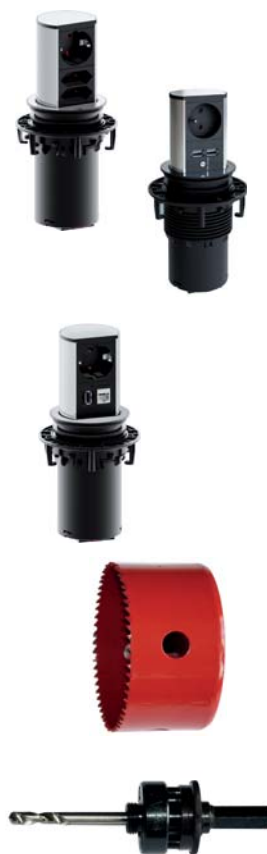
podobne do rysunku